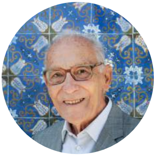
para o Calendário APG 365, edição de 2024.